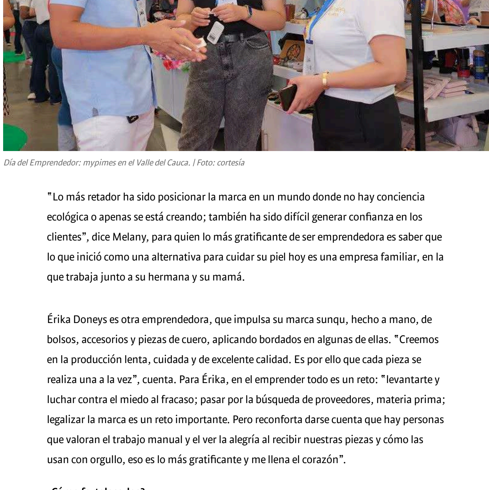
Día del Emprendedor: mypimes en el Valle del Cauca.

En Colombia, en 2023, el 56,2 % de los colombianos consideró el emprendimiento como una elección deseable; el 61,6 % dijo que quienes tienen éxito al emprender gozan de un alto nivel de estatus en el país, y el 62,2 % afirmó que a menudo en los medios de comunicación publican noticias sobre nuevos empresarios que han tenido éxito en sus negocios.