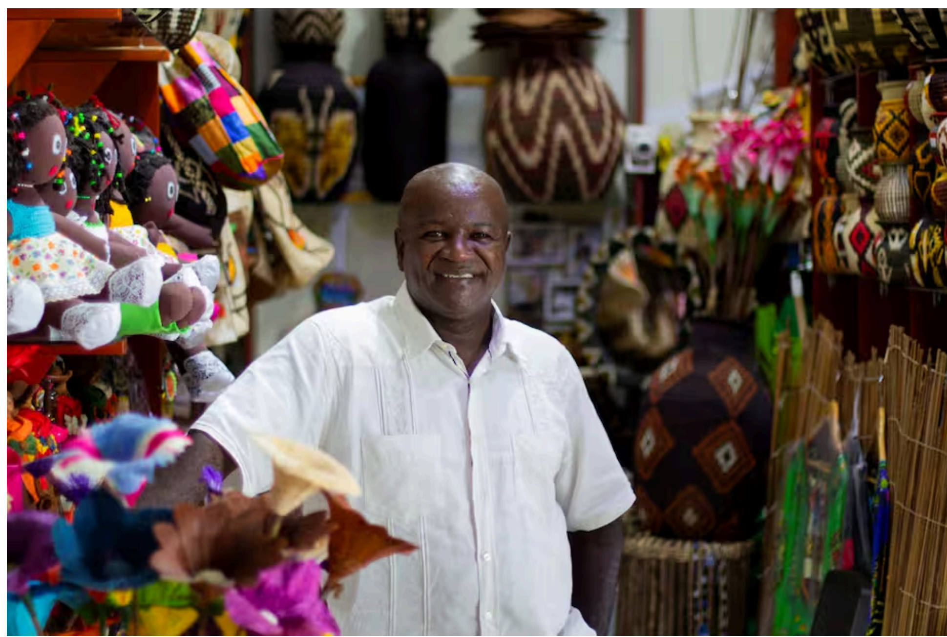
A ayudamos a los microempresarios a acceder a servicios y canales financieros con requisitos y trámites sencillos y sin costo.